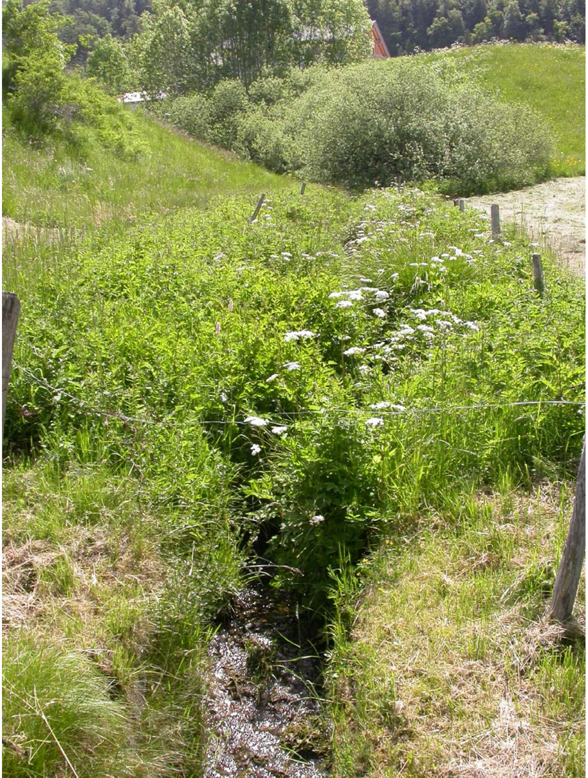
Le canyon au fond duquel le ruisseau descend en direction du bord du lac de Joux.