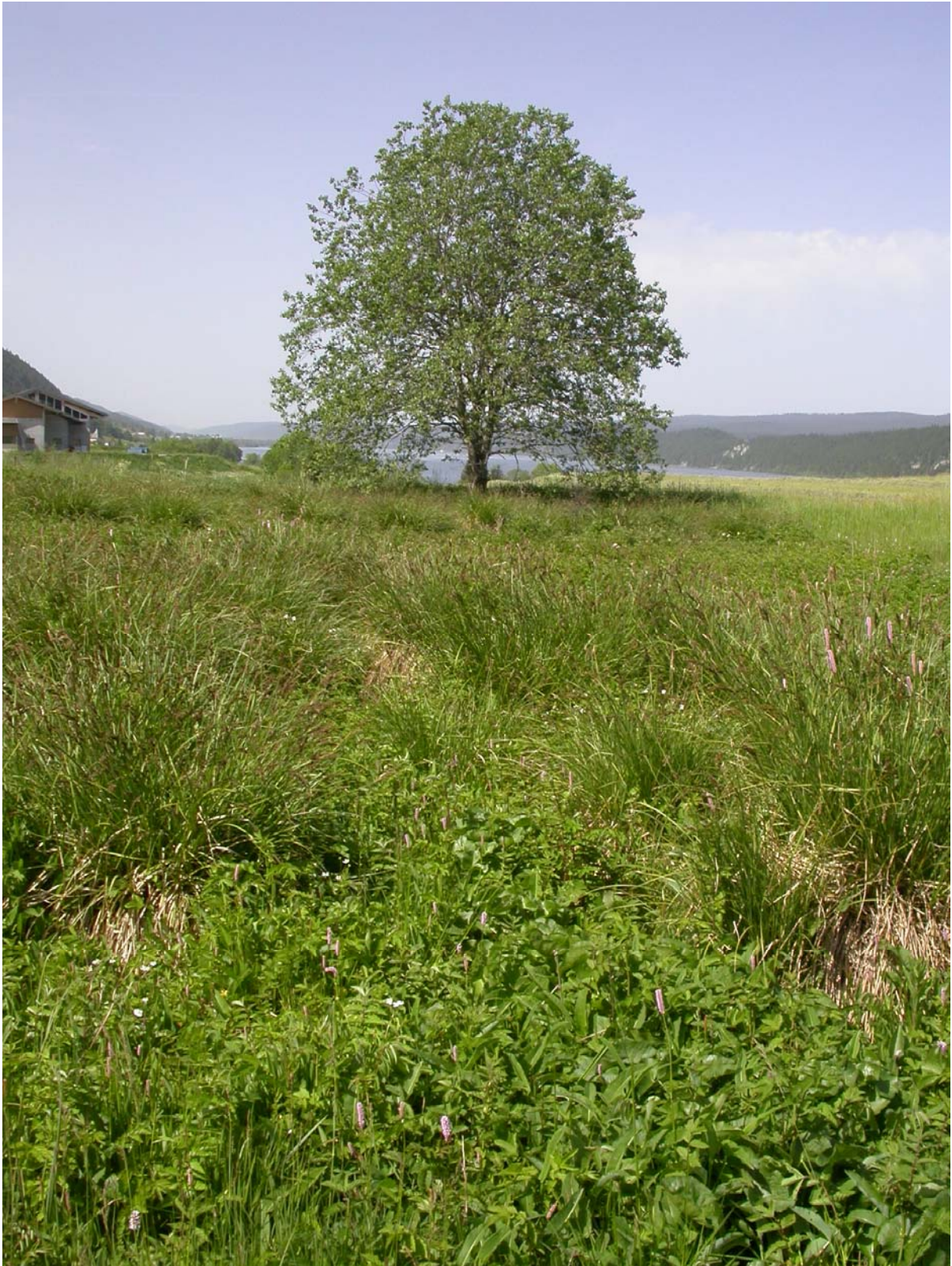
Zone marécageuse et non cultivée, avec la présence de nombreux « chevelus ».