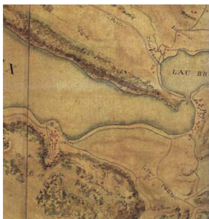
Carte IGN de 1785. Le ruisseau n'est pas signalé dans le vaste triangle que constituent les Grands Champs.

On va retrouver les Grands Champs, comme aussi leur ruisseau, par le biais de trois documentations : cartes anciennes – photos anciennes – photos actuelles.