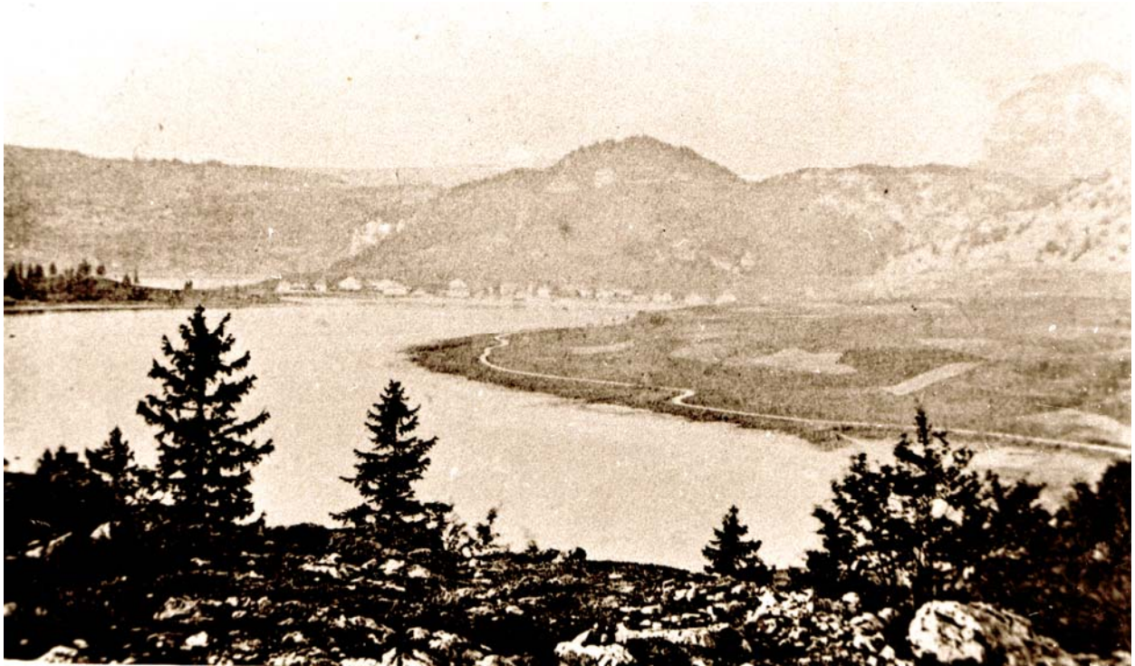
fin du XIXe siècle. Le morcellement des parcelles est bien visible.