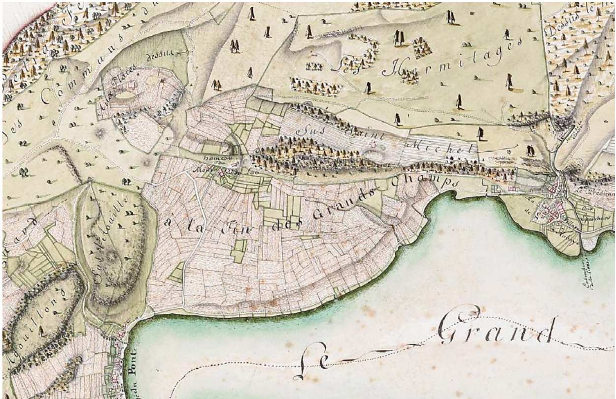
A la Fin des Grands Champs. Carte établie par les frères Wagnon d'après le cadastre de l'Abbaye de 1814 (ACV). Le ruisseau est visible au centre de la carte qui se jette bientôt dans le Grand Lac de Joux.