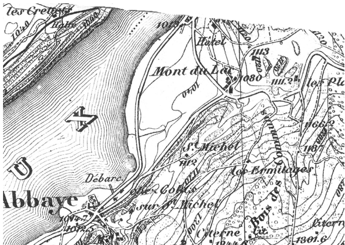
Carte topographique du canton de Vaud, base 1880. Le ruisseau est visible à gauche du vaste triangle formé par le territoire des Grands Champs.