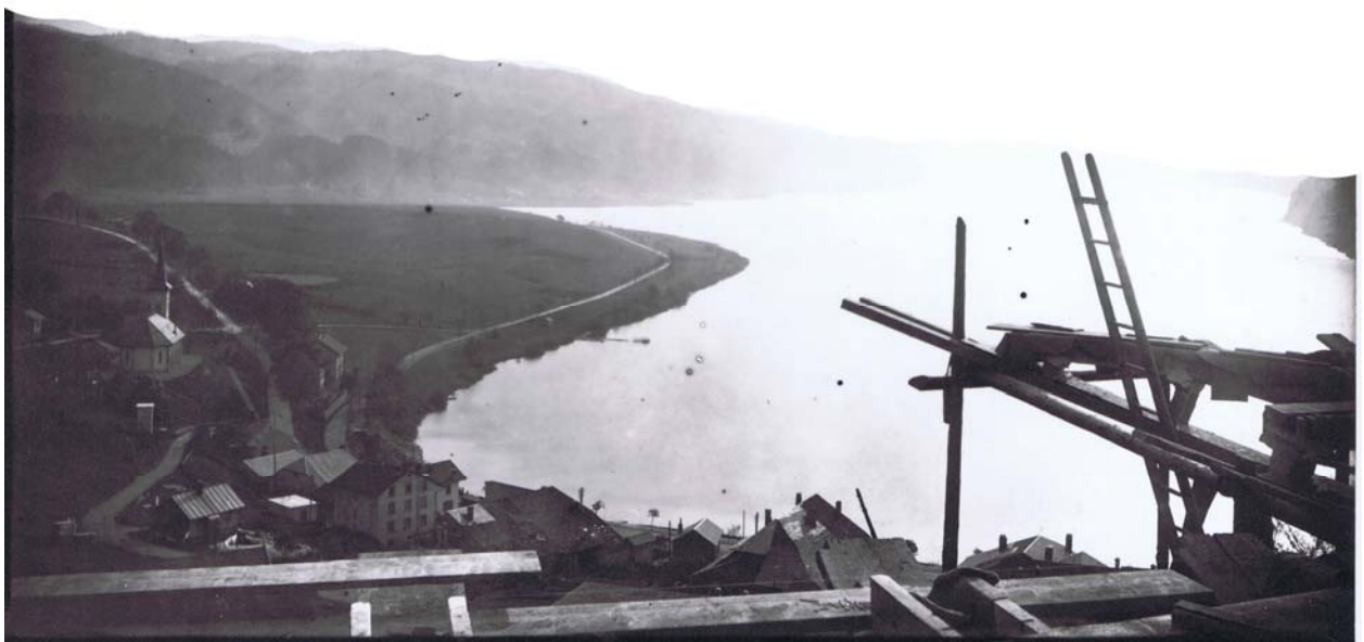
Les Grands Champs entre le Pont et l'Abbaye vus depuis le chantier de la Villa Bunau-Varilla en 1911 environ.