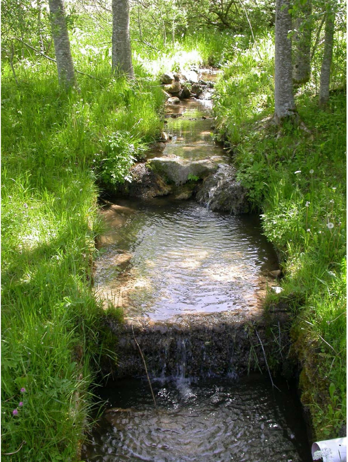
Le ruisseau a franchi la route ...